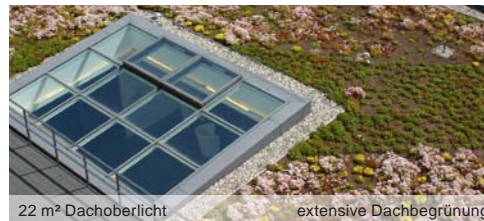
22 m² Dachoberlicht